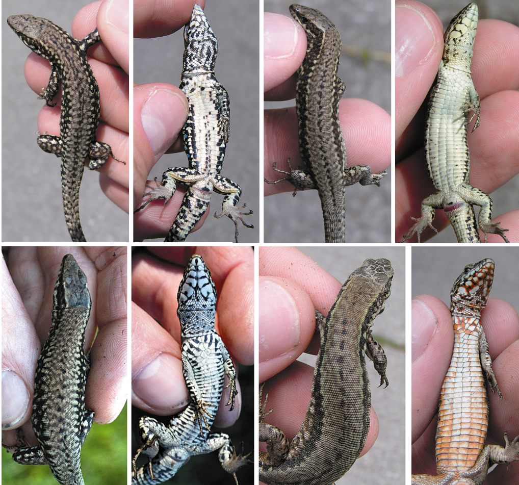
Tafel 4: Obere Reihe von links: Romagna-Linie. Männchen dorsal und ventral (Inzlingen, Standort 63). Weibchen dorsal und ventral (Inzlingen, Standort 63). Untere Reihe von links: Marche-Linie. Männchen dorsal und ventral (München-Aubing, Standort 79), Hybrid zwischen der Toskana-, Südalpen- und Ostfranzösischen-Linie. Weibchen dorsal und ventral (Freiburg Dreisam, Standort 59). Fotos: U. SCHULTE (obere Reihe und untere Reihe Hybriden); J. GEBHART (untere Reihe Marche-Linie).

Upper row from left: Romagna lineage. Dorsal and ventral view of a male (Inzlingen, locality 63), dorsal and ventral view of a female (Inzlingen, locality 63). Lower row from left: Marche lineage. Dorsal and ventral view of a male (München-Aubing, locality 79), Hybrid between Tuscany, Southern Alps and Eastern France lineages. Dorsal and ventral view of a female (Freiburg Dreisam, locality 59).