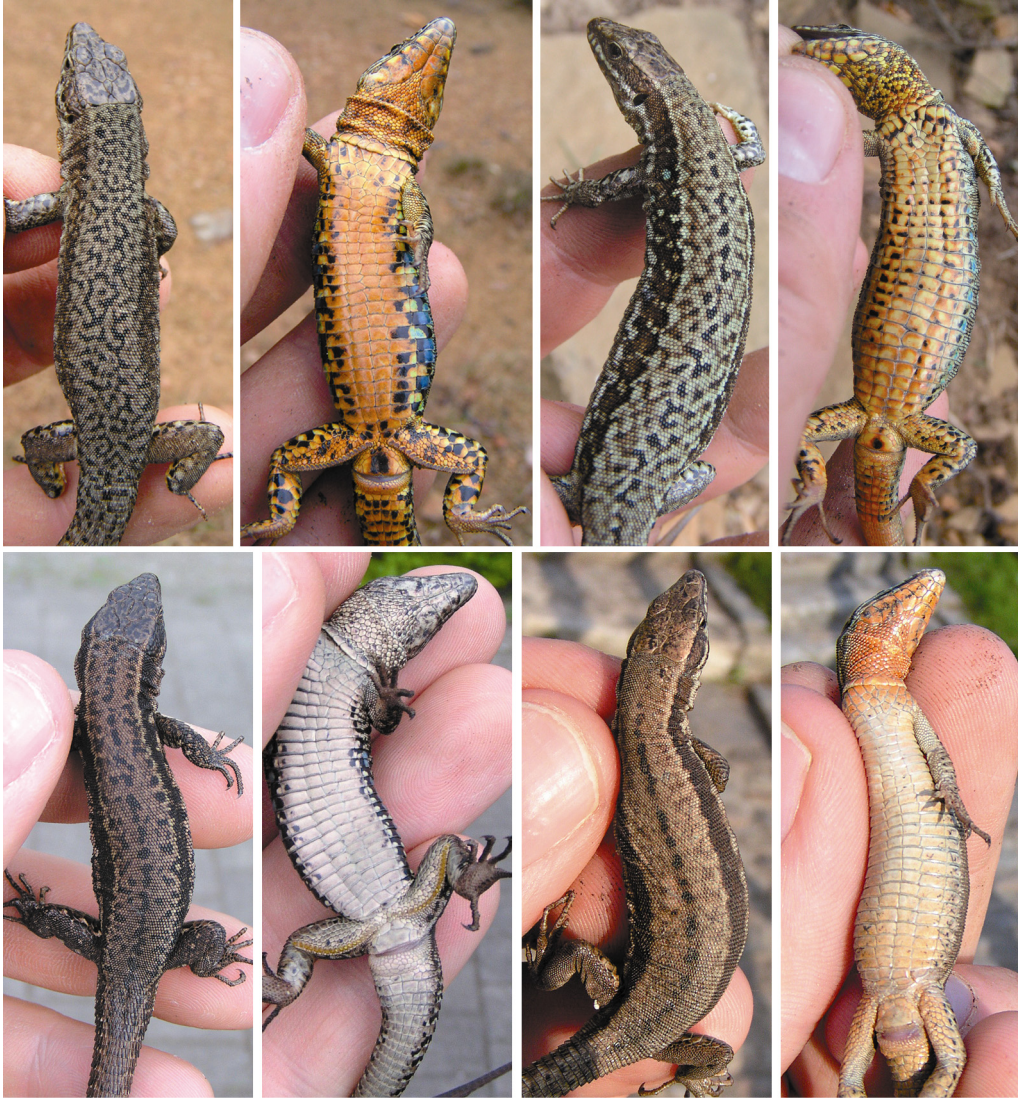
Tafel 1: Obere Reihe: Südalpen-Linie. Von links: Männchen dorsal und ventral (Ueffeln, Standort 1), Weibchen dorsal und ventral (Ueffeln, Standort 1). Untere Reihe: Ostfranzösische Linie. Von links: Männchen dorsal und ventral (Duisburg Innenhafen, Standort 21), Weibchen dorsal und ventral (Lörrach, Standort 61).

Upper row: Southern Alps lineage. From left: dorsal and ventral view of a male (Ueffeln, locality 1), dorsal and ventral view of a female (Ueffeln, locality 1). Lower row: Eastern France lineage. From left: dorsal and ventral view of a male (Duisburg basin, locality 21), dorsal and ventral view of a female (Lörrach, locality 61).