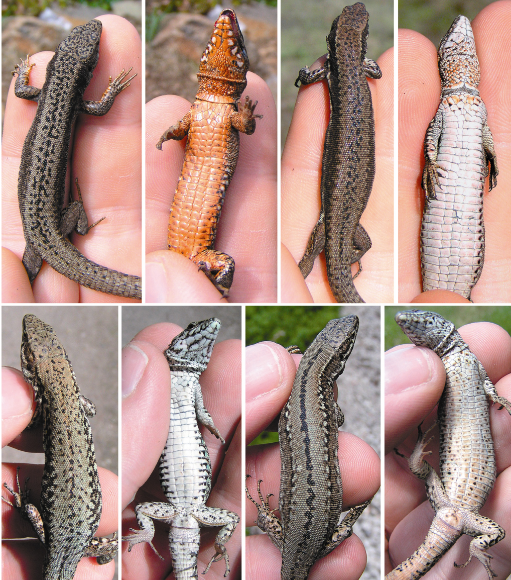
Tafel 3: Obere Reihe: Zentral-Balkan-Linie. Von links nach rechts: Männchen dorsal und ventral (Ammelshain, Standort 35), Weibchen dorsal und ventral (Ammelshain, Standort 35). Untere Reihe: Westfranzösische Linie. Von links nach rechts: Männchen dorsal und ventral (Nörten-Hardenberg, Standort 5), Weibchen dorsal und ventral (Gernsheim, Standort 44).

Upper row: Central Balkan lineage. From left to right: dorsal and ventral view of a male (Ammelshain, locality 35), dorsal and ventral view of a female (Ammelshain, locality 35). Lower row: Western France lineage. From left to right: dorsal and ventral view of a male (Nörten-Hardenberg, locality 5), dorsal and ventral view of a female (Gernsheim, locality 44).