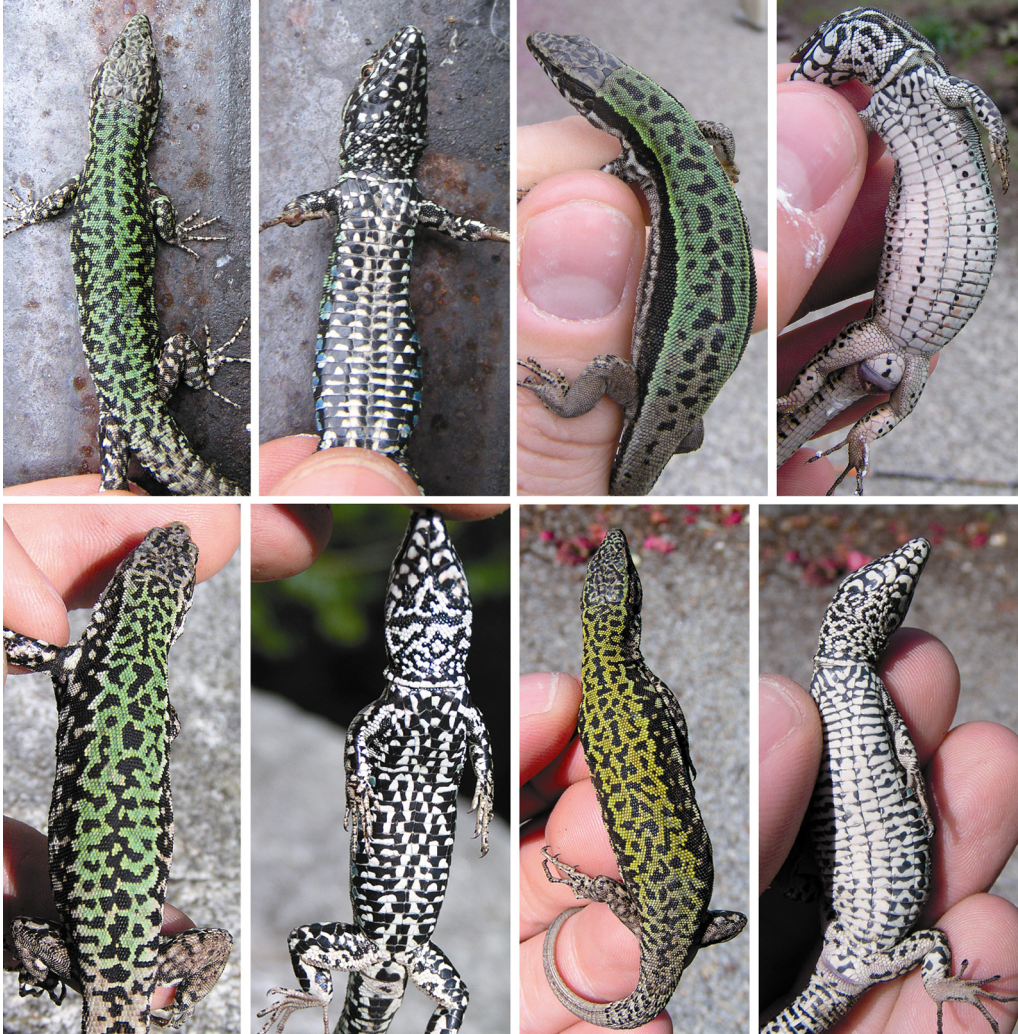
Tafel 2: Obere Reihe: Venetien-Linie. Von links nach rechts: Männchen dorsal und ventral (Mannheim, Standort 46), Weibchen dorsal und ventral (Hannover, Standort 3). Untere Reihe: Toskana-Linie. Von links nach rechts: Männchen dorsal und ventral (Schärding, Österreich), Weibchen dorsal und ventral (Schärding, Österreich).

Upper row: Venetian lineage. From left to right: dorsal and ventral view of a male (Mannheim, locality 46), dorsal and ventral view of a female (Hannover, locality 3). Lower row: Tuscany lineage. From left to right: dorsal and ventral view of a male (Schärding, Austria), dorsal and ventral view of a female (Schärding, Austria).