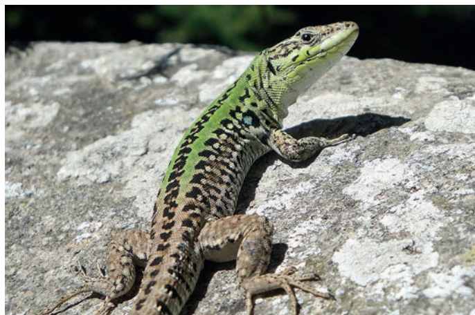
Podarcis siculus