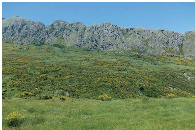
Habitat di Podarcis siculus

conferma periodica della presenza della specie. Per valutare il range nazionale si utilizzeranno modelli basati sul rilevamento del numero di “località” (1 kmq) all’interno della griglia nazionale di 10x10 km. Per ogni anno di rilevamento, verranno considerati il numero di segnalazioni per ciascuna cella e il numero totale di celle con segnalazioni. Il numero di segnalazioni totali di tutte le specie di rettili in tali celle sarà considerato come una misura dello sforzo di campionamento. La frequenza delle specie verrà quindi analizzata con modelli gerarchici.