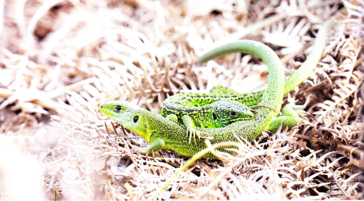
Il corteggiamento è spesso alquanto violento, Roccamorice, PE.

Croazia (Amann et al., 2001). Tuttavia, sulla base di ulteriori studi genetici, alcuni autori proposero di considerare le popolazioni occidentali ( L. bilineata ) come sottospecie di L. viridis in attesa di ulteriori approfondimenti (Godinho et al., 2005; Haris & Salvador, 2009). Anche la classificazione delle diverse sottospecie appare controversa: Nettmann (2001) ne riconosce ben quattro per L. bilineata . Uno studio più recente sul DNA mitocondriale sembrerebbe