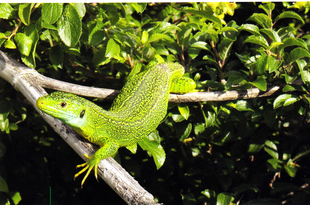
Il Ramarro occidentale si arrampica spesso sugli arbusti per esporsi al sole e termoregolarsi, Castel di Sangro, AQ.

stagionale, nelle ore centrali in primavera e autunno, al mattino e nel secondo pomeriggio in estate.